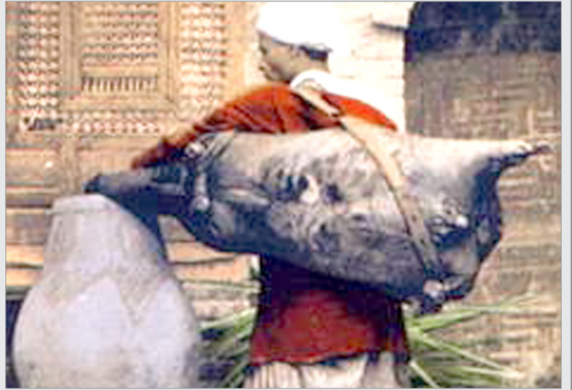
مهنة السقا من المهن القديمة التي سادت ثم بادت وتطورت في أشكال أخرى