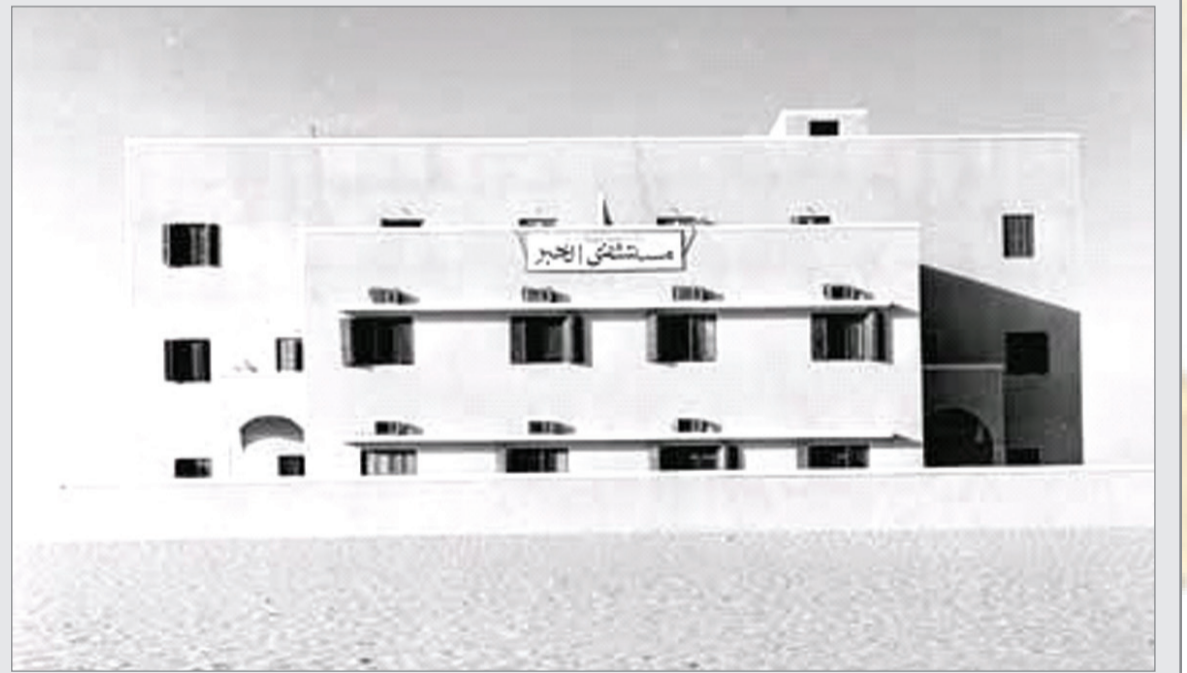
مستشفى الخبر العام عام ١٣٧٦ هـ