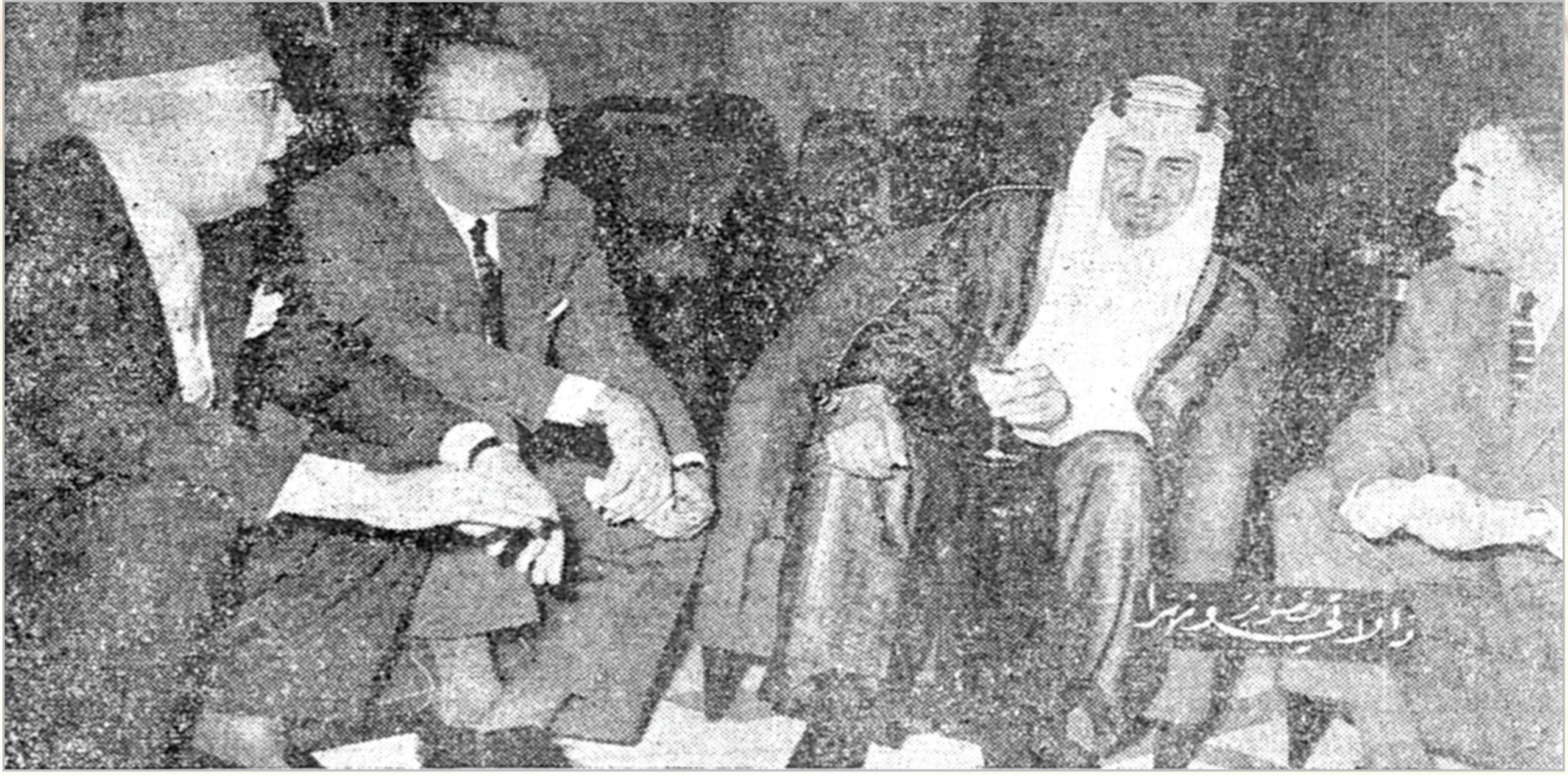
حضرة صاحب السمو الملكي الامير فيصل يتوسط رشيد كرامي والوزير نقلا