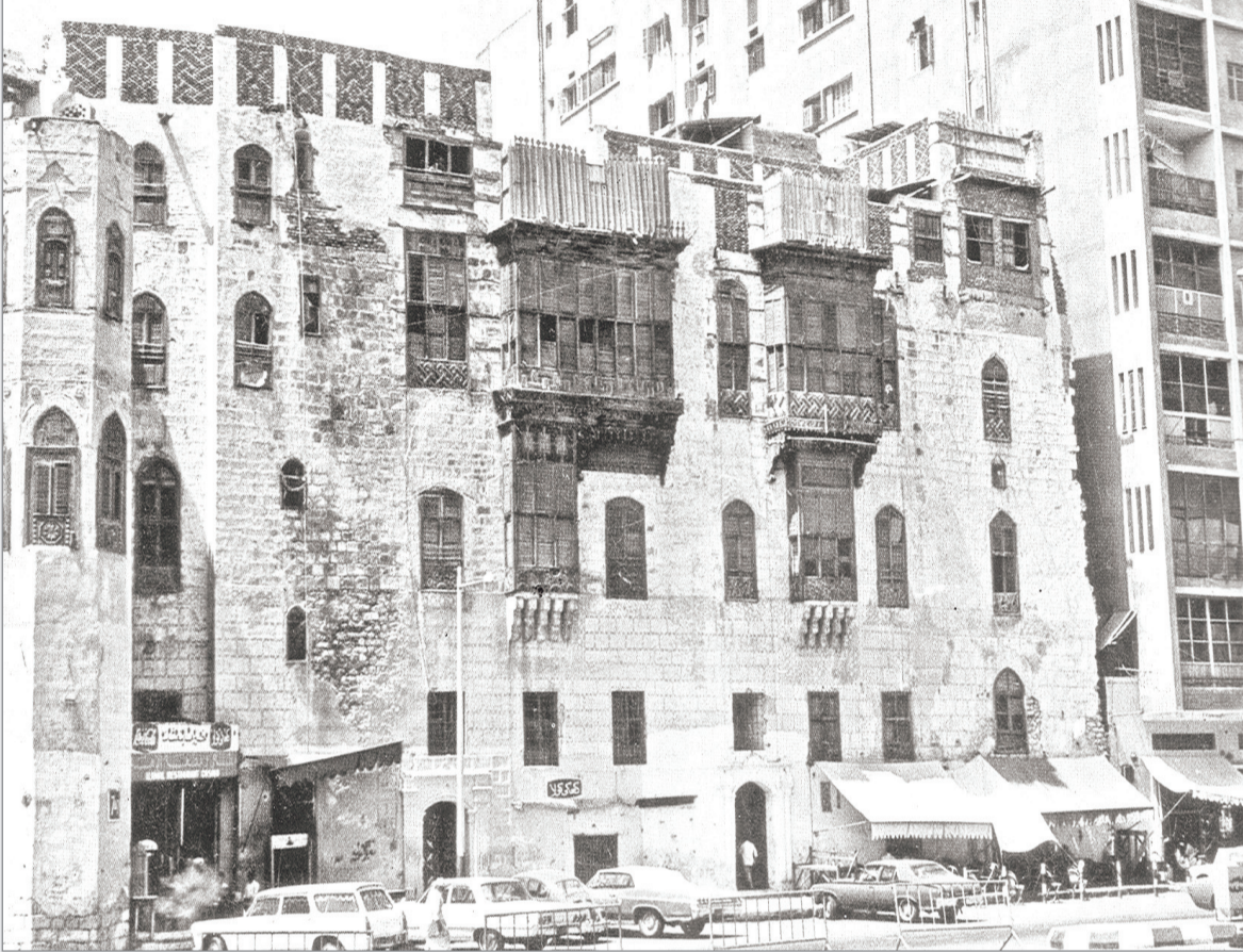
الطرز القديم لمباني مكة المكرمة ..