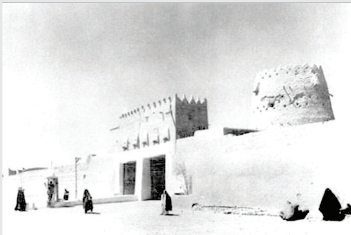
بوابة التميري بعد توسعتها في عهد الملك عبدالعزيز