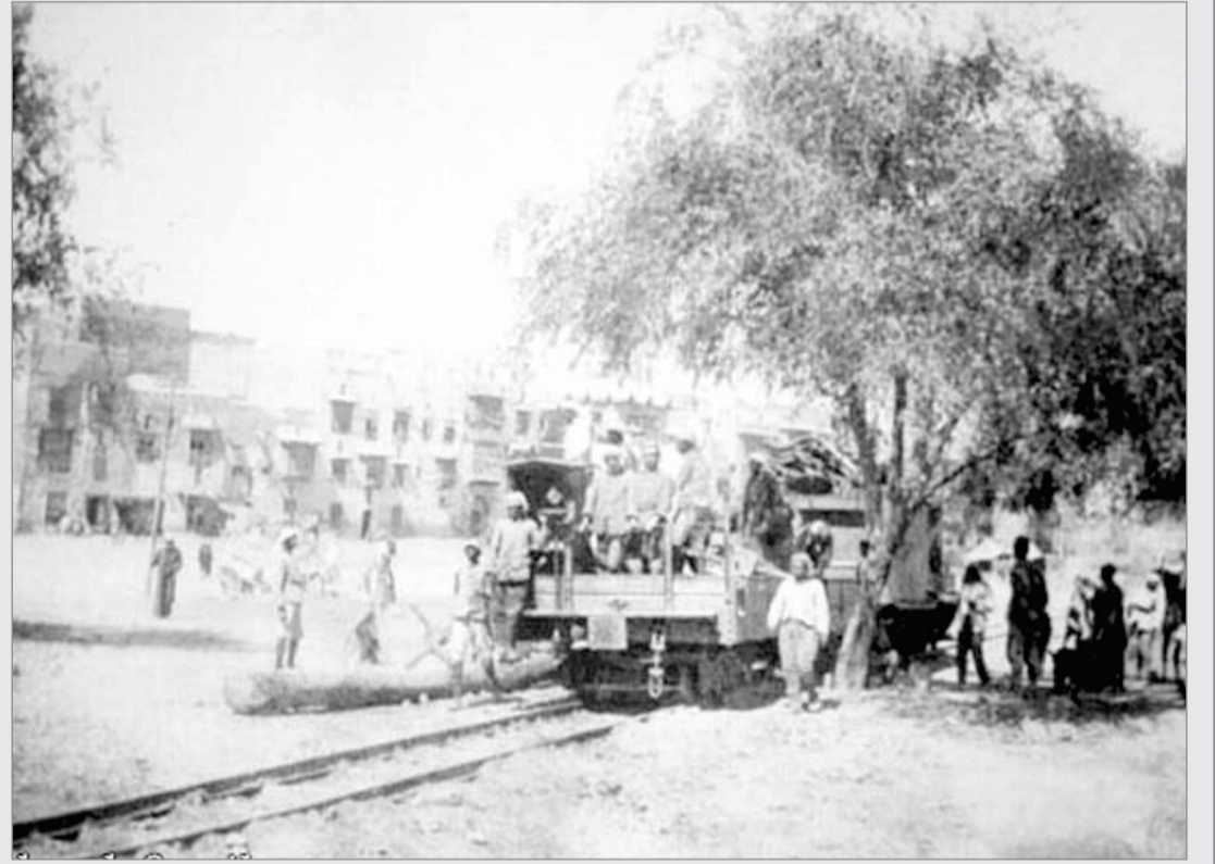
العاملين في محطة قطار الحجاز