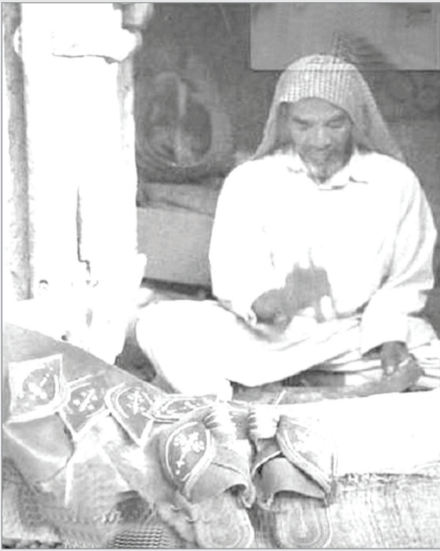
صانع (الغزال) النجدية