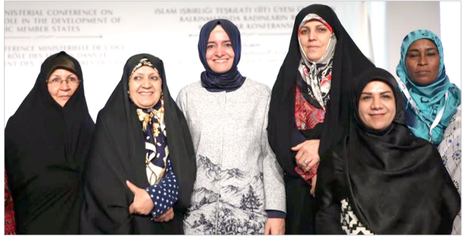
ودعا البيان "حكومات الدول الأعضاء إلى الاهتمام بشكل أكثر بالحفاظ على قيم مؤسسة الزواج والأسرة، والعمل عن قرب مع الأمانة العامة لتنفيذ خطة المنظمة من أجل النهوض بالمرأة".

إسطنبول- الأناضول دعت الدورة السادسة للمؤتمر الوزاري حول دور المرأة في تنمية الدول الأعضاء في منظمة التعاون الإسلامي إلى "ضرورة الإسراع في إعداد عهد حقوق المرأة في الإسلام". جاء ذلك خلال اختتام أعمال الدورة السادسة للمؤتمر الوزاري حول دور المرأة في تنمية الدول الأعضاء في منظمة التعاون الإسلامي، التي تواصلت فعالياته، مساء الخميس، على مدار يومين، في مدينة إسطنبول التركية.