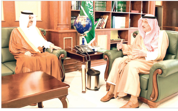
من تطور ونمو في مختلف المجالات التنموية والخدمية وما تجده من رعاية واهتمام من قبل القيادة الرشيدة كغيرها من مناطق المملكة.

واستمع سمو أمير منطقة جازان من الدكتور بن سلمه لشرح عن المهام والأعمال التي تقوم بها الجهات التابعة للوزارة مبينا أن زيارته والوفد المرافق تأتي بتعليمات من معالي وزير الثقافة والإعلام الدكتور عادل بن زيد الطريفي للقيام بالعديد من المهام ذات العلاقة بعمل الوزارة. وفي نهاية الاستقبال أعرب بن سلمه عن سعاده بالزيارة وما استمع إليه والوفد المرافق خلال اللقاء من توجيهات من سمو أمير منطقة جازان حول أهمية التعريف بالمنطقة وما تزخر به من مقومات سياحية واقتصادية وزراعية وغيرها من المجالات عبر مختلف الوسائل الإعلامية مبديا إعجابها بما شهدته وتشهده المنطقة