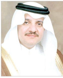
سعود بن نايف

وجه صاحب السمو الملكي الأمير سعود بن نايف بن عبدالعزيز أمير المنطقة الشرقية، بإقامة الملتقى الأول للمتحدثين الرسميين في المنطقة الشرقية "ناطق" الذي تنظمه إدارة الإعلام بإمارة المنطقة الشرقية، ويهدف إلى تبادل الخبرات المتحدثين الرسميين من مختلف الجهات وتبادل وجهات النظر في التعامل مع وسائل الإعلام وإدارة الأزمات المحلية.