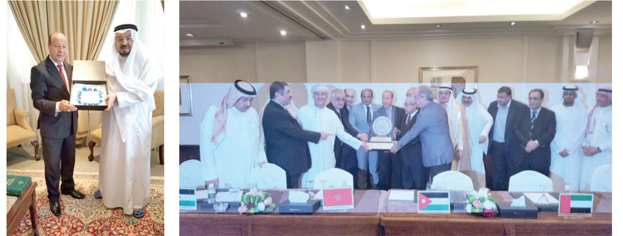
جدة - عبد الهادي المالكي اقام السفير محمد أحمد الطيب مدير عام فرع وزارة الخارجية بمنطقة مكة المكرمة والمندوب الدائم للمملكة لدى منظمة التعاون الإسلامي حفل تكريم للقنصل العام التونسي السفير فتحي النفاتي بعد ما أنهى فترة خدمته التي تكلت بالكثير من الإنجازات والعطاءات ومد جسور التعاون بين المملكة العربية السعودية وتونس وكل التسهيلات والخدمات للجالية التونسية. وفتح النفاتي ترك الأثر الجميل في نفوس الجميع، وكل من التقى به عرف عنه المحبة والتواضع وجميل الوصال، وعلى مدى مشواره الدبلوماسي بجدة أكد محبة الشعب التونسي الشقيق للمملكة.