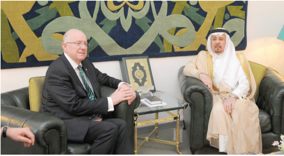
الرياض - واس استقبل معالي وزير الدولة للشؤون الخارجية الدكتور نزار بن عبيد مدني في مكتبه بالوزارة، معالي وزير الخارجية والتجارة بجمهورية أيرلندا تشارلس فلانجان. وجرى خلال الاستقبال مناقشة الموضوعات ذات الاهتمام المشترك، واستعراض أوجه التعاون بين البلدين وتنميتها.