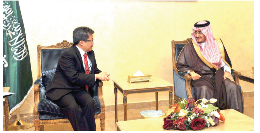
مكة المكرمة - واس استقبل صاحب السمو الأمير فيصل بن محمد وكيل إمارة منطقة مكة المكرمة المساعد للحقوق، بمكتبه بالإمارة بمكة المكرمة القنصل العام للجمهورية الاندونيسية محمد هيري شريف الدين. وجرى خلال اللقاء تبادل الأحاديث الودية ومناقشة الموضوعات ذات الاهتمام المشترك. ونوه قنصل عام جمهورية اندونيسيا، بما تقدمه حكومة خادم الحرمين الشريفين الملك سلمان بن عبد العزيز آل سعود - حفظه الله - من تسهيلات وخدمات لقاصدي بيت الله الحرام من الزوار والمعتمرين.