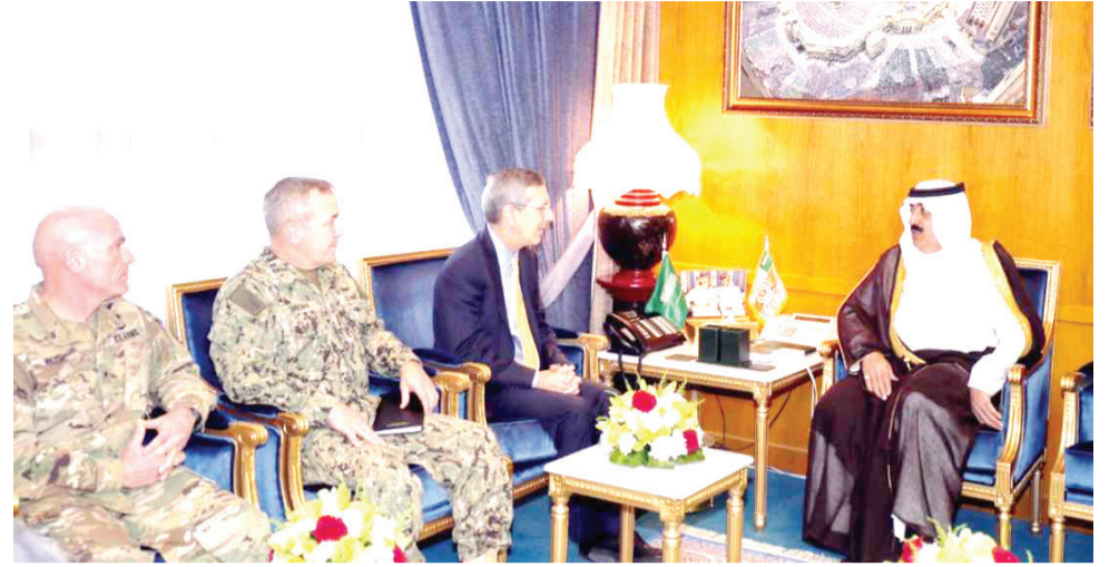
الرياض - واس استقبل صاحب السمو الملكي الأمير متعب بن عبدالله بن عبدالعزيز وزير الحرس الوطني في مكتبه بالوزارة، امس، النائب الأول لوكيل وزارة الدفاع الأمريكية للتكنولوجيا والخدمات اللوجستية الأن ستيفنز والوفد المرافق له. وجرى خلال الاستقبال تبادل الأحاديث الودية واستعراض أوجه العلاقات الثنائية بين البلدين. حضر الاستقبال معالي نائب وزير الحرس الوطني الأستاذ عبد المحسن بن عبدالعزيز التويجري ومعالي رئيس الجهاز العسكري الفريق محمد بن خالد الناهض.