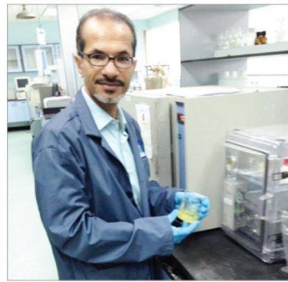
عديمة السمية والآثار السلبية على الجسم البشري وأيضا الخلايا السرطانية ليس لها القدرة على مقاومة مركبات الذهب متى يستفيد منه السعوديون؟