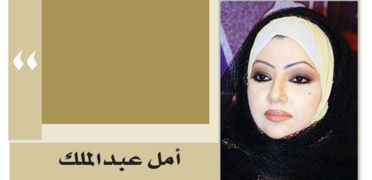
أم عبد الملك