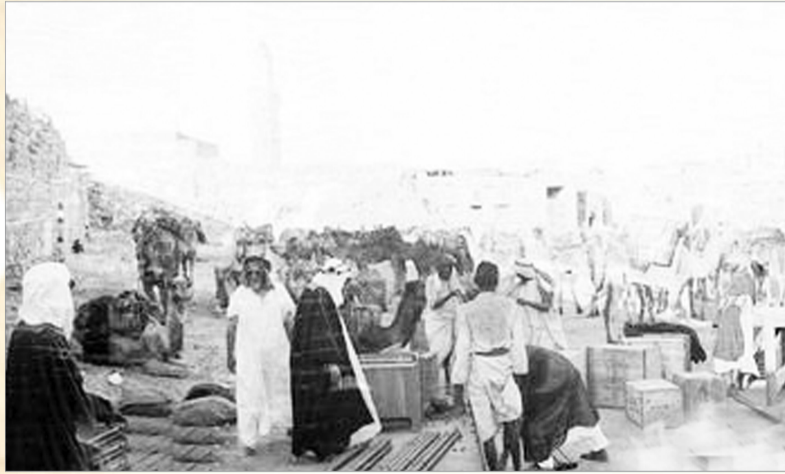
من أسواق ينبع