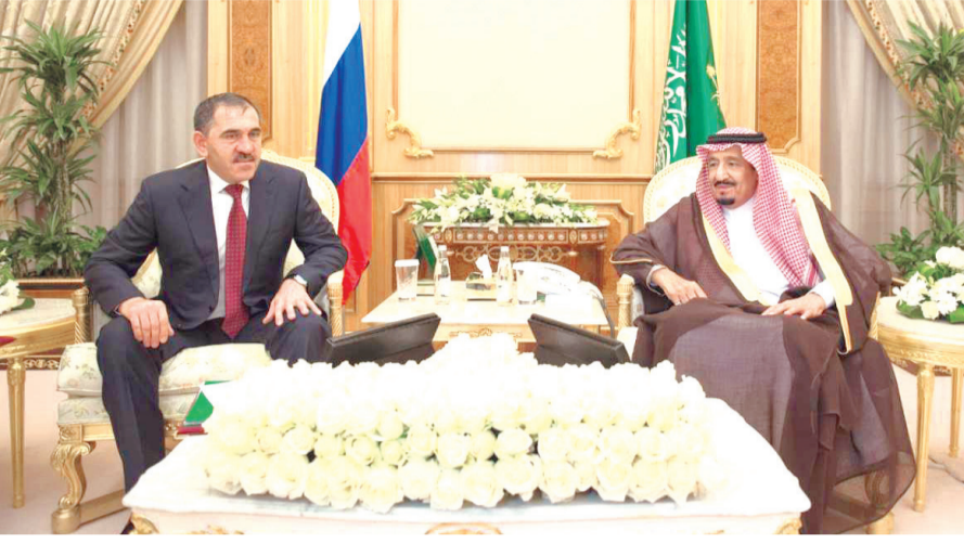
خادم الحرمين الشريفين ورئيس إنغوشيا يبحثان التعاون.. ص 3

بسم الله الرحمن الرحيم www.albiladdaily.com