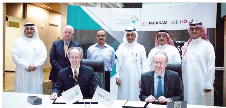
جانب من حفل إطلاق البرنامج المشترك

لانتقال من المختبر إلى السوق». وأضاف: «نحن متحمسون للعمل مع سبب في هذا البرنامج الجديد الرامي إلى تسريع المشاريع الجامعية الجديدة، ومساعدة الشركات الناشئة على أخذ فرصتها وتحقيق كامل إمكاناتها...» جدير بالذكر أن برنامج "تقدم" مفتوح أمام جميع الطلبة وأعضاء هيئة التدريس والموظفين وخريجي الجامعات الجدد السعوديين؛ حيث يجب أن يمتلك المتقدم فكرة تجارية قادرة على