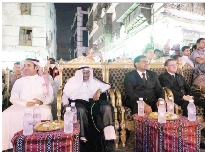
وحاضرهما يفتتح على أسس ومبادئ مشتركة هدفها حماية الهوية الإسلامية والتمسك بالقيم الأصيلة لكل منهما.