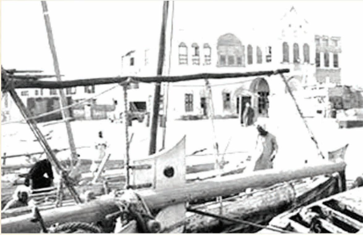
مدينة رأس تنورة - الخمسينيات