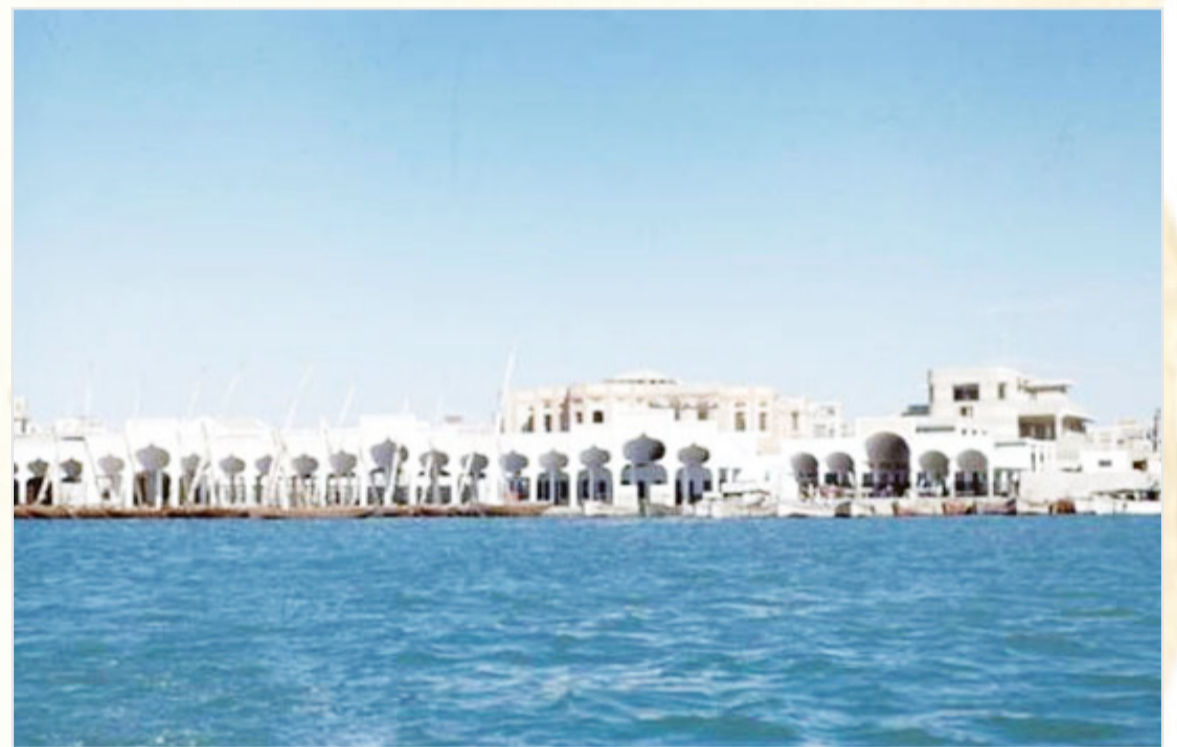
مبنى الجمارك بجدة ١٩٤٧ م