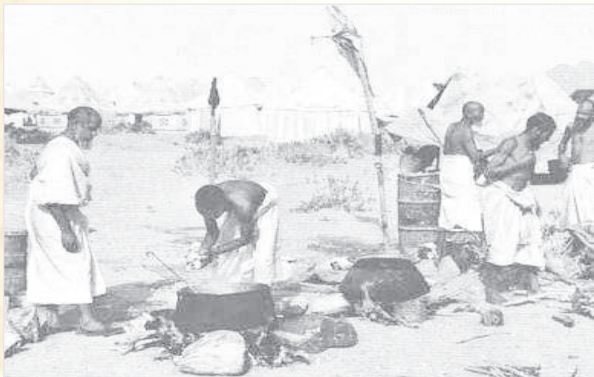
الحج ١٩٥٨ م