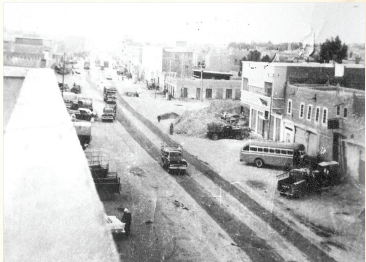
من الشوارع القديمة في مدينة بريدة