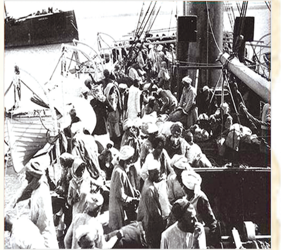
ميناء جدة الإسلامي