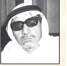
محمد عمر توفيق

علم محرر "البلاد" ان معالي وزير المواصلات الاستاذ محمد عمر توفيق قد اصدر اوامره الفورية الى الجهات المختصة في وكالة مصلحة الطرق بالمنطقة الغربية مباشرة العمل الفوري في تعبيد طريق الطائف القديم. وقد علم ان فرق هندسية خاصة يتم الآن تشكيلها في وكالة مصلحة بجدة لتتولى الاسراع.. العمل لتنفيذ المشروع خلال اليومين القادمين.