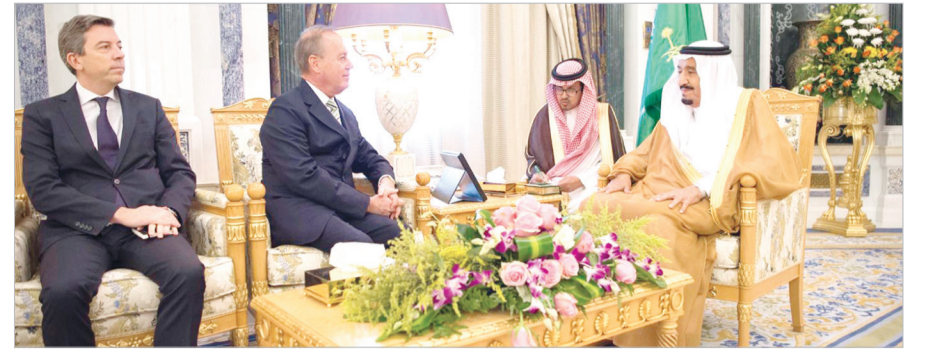
خادم الحرمين يستقبل السفير الفرنسي - ص ٣