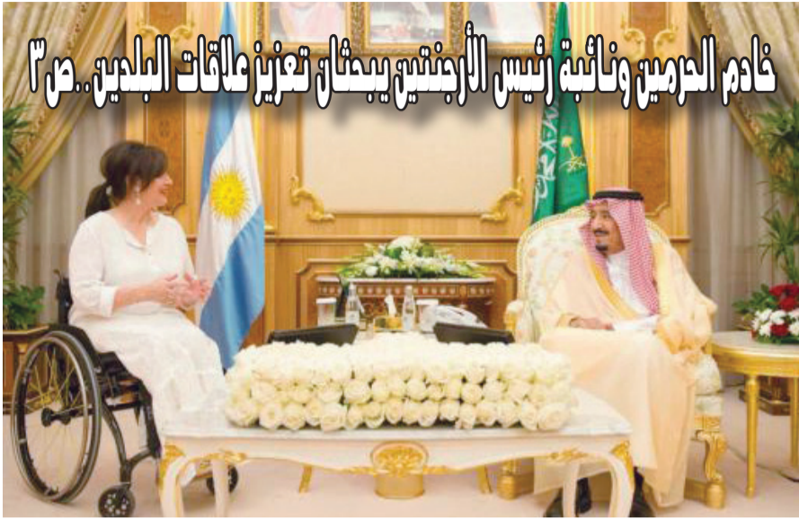
خادم الحرمين ونائبة رئيس الأجنحة يبحثان تعزيز مآلات البلدين.. ص 3