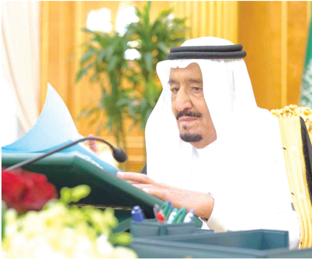
خادم الحرمين الشريفين لدى ترؤسه جلسة مجلس الوزراء أمس

Facebook: albiladdailynews Twitter: albiladdailynew Instagram: albiladdaily Google+: albiladdaily