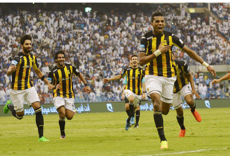
الاتحاد بجدارة استعاد الصدارة

الظهران- حمود الزهراني عقبت شركة أرامكو السعودية على ما تناوله وصرحت به وسائل الاعلام حول قضية فساد تخص شركة امبراير البرازيلية بالتوضيح من أنها قامت قبل عدة سنوات من خلال أنشطة التابعة الداخلية عن كشف قضية تتعلق بإحدى التعاملات التي قامت بها شركة امبراير س. أ. البرازيلية) مع أرامكو السعودية، حيث ثبت من خلال التحقيق الداخلي وكذلك بمساعدة هامة ورئيسية من أجهزة وزارة الداخلية في المملكة تورط موظف سابق في أرامكو السعودية في استلام رشوه مقابل تسهيل عملية شراء ثلاث طائرات. وقد كان من شأن هذا التعاون المتمكن من اتخاذ الإجراءات التأديبية المنصوص عليها بحق الموظف السابق المعني وفق أنظمة الشركة ومن ثم إحالته إلى السلطات الحكومية في المملكة والتي بدورها حالته إلى هيئة التحقيق والادعاء العام، كما تم إيقاف أي تعامل مستقبلي مع شركة امبراير منذ ذلك الحين. وترجع ملاسبات القضية الى عام 2012م، حيث قامت أرامكو السعودية بعملية تدقيق داخلي حول إحدى التعاملات مع الشركة المذكورة واكتشفت بعض المخالفات التي تتعلق بها، مما استدعى المبادرة بإجراء تحقيق داخلي استباقي بالتعاون مع الجهات المختصة في المملكة في مثل هذه القضايا مما أكد تورط أحد موظفي الشركة السابقين في تلك المخالفات. ص 5