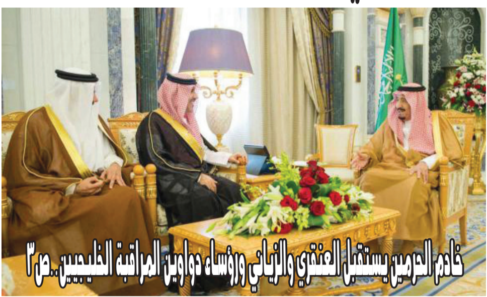
قادم الحرمين يستقبل الصنوبري واليابي وروساء دواوين المراقبة الخليجيين ص 3