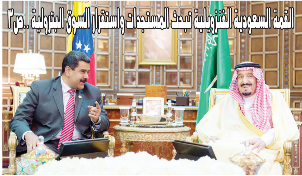
القيامة السعودية الثورية تحت المسححات واستقرار السوق البترولية ص ٣