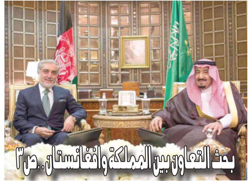
بحث التعاون بين المملكة والأفغانستان.. ص ٣

Facebook: albiladdailynews Twitter: albiladdailynew Instagram: albiladdaily Google+: albiladdaily