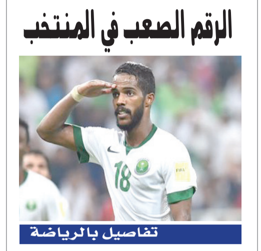
الرقم الصعب في المنتخب

Facebook: albiladdailynews Twitter: albiladdailynew Instagram: albiladdaily Google+: albiladdaily