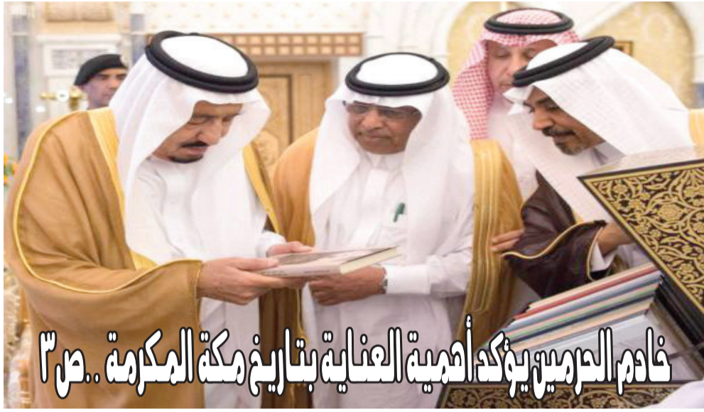
خادم الحرمين يؤكد أهمية العناية بتأريخ مكة المكرمة.. ص 3