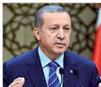
رجب طیب اردوغان

دبی-العربیة بنت فارسی رجب طیب اردوغان، رئیس جمهور ترکیه گفته است که نیروهای نظامی این کشور تا طرد کامل داعش از مرزهای این کشور به عملیات خود در داخل خاک سوریه ادامه خواهند داد.