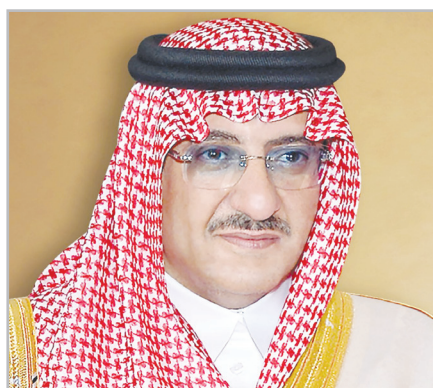
محمد بن نایف

ولیعهد نیز ضمن عرض تبریک متقابل از خداوند خواست این عید را برای امت اسلامی مملو از خیر و برکت و شادمانی بگرداند.