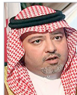
خالد بن علی آل خلیفه

شیخ خالد بن علی آل خلیفه وزیر دادگستری و شئون اسلامی بحرین موفقیت آمیز بودن موسم حج امسال ۱۴۳۷ هـ را ستود و تأکید کرد این موفقیت در کارنامهی موفقیت‌های عربستان سعودی ثبت خواهد شد، و این کشور در طول تاریخ ثابت کرده است که توانایی خدمت به مشاعر مقدسه را دارد، و در قامت عنایتی است که خداوند به آن‌ها در سرپرستی حرمین شریفین ارزانی داشته است.