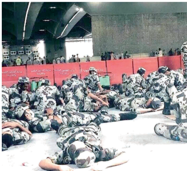
رجال الأمن يلقون بجسادهم على الأرض بعد شهر يومين في خدمة الحجاج