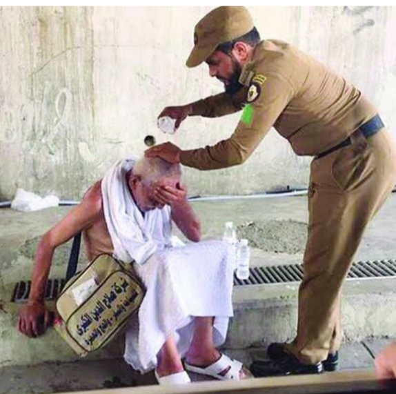
رجل أمن يصب الماء لتخفيف حرارة الشمس

أن نتحدث في المملكة العربية السعودية، عن أخلاق الإسلام والحب والإنسانية، فهذا يعني أن نتحدث عن رجال الأمن الذين نجحوا بتنظيم أكثر من مليوني حاج بكل تقان وإخلاص، هم من وصفهم أحدهم على تويتر: فاق التصور فلكم والله فاق. يا أهل الكرم والمرجلة. وشكركم آخر: بيض الله وجوهكم . تجسيدا جسد ضباط وأفراد القوات الأمنية المشاركة في الحج لهذا العام ١٤٢٧هـ سواء كانت الداخلية أو الدفاع أو الحرس أروع الملاحم في حفظ أمن الحجاج في المشاعر المقدسة، ولا تجد زاوية أو ممر إلا ورجال الأمن على أهبة الاستعداد لمساعدة الأطفال وكبار السن والنساء، يوجهون التائهين ويساندون كبار السن، ويمنعون الاقتراض، ويضبطون الأمن للجمع، انهم رجال يتنافسون فيما بينهم لخدمة ضيوف الرحمن يرتجون رضى رب العالمين ودعوة صادقة من الحجاج. وقد عجت مواقع التواصل الاجتماعي بالصور والمقاطع للعديد من رجال الأمن منها تمكن العديد من كبار السن والمعاقين من رمي الجمرات، وخلافه من المواقف الإنسانية لرجال الأمن والتي تجسدت في إعانة كبار السن ومساندتهم للتسهيل في أداء فريضة الحج لكل المحتاجين، يعاملون كافة الحجاج بالصننى، قوتهم في ايديهم، يتفكرون وقوفاً طلباً للأجر ودعوة مستجابة، ويلقون التقدير والاحترام من الجميع، ومن المواقف الإنسانية قيام العديد منهم بتوزيع الماء ورشه على رؤوس الحجاج للتخفيف عليهم من لهب الشمس وسوم الحر، وحمل العربات للعاجزين، وغيرها الكثير، انهم رجال وهبوا أنفسهم لخدمة ضيوف الرحمن من كافة أصقاع الأرض.