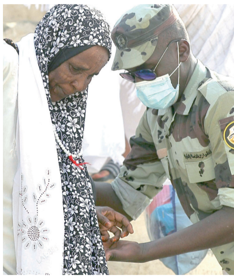
جندي يأخذ بيد مسنة