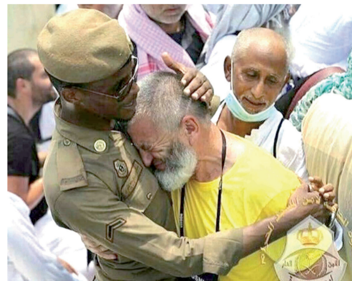
شرطي يضم حاجا لصدره ويخفف مصابه