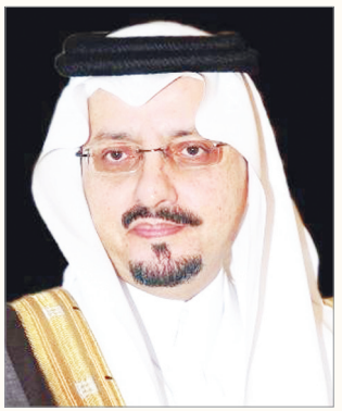
الأمير فيصل بن خالد

ونسجل فخراً واعتزازنا بالمنجزات الحضارية الفريدة والشواهد الكبيرة التي أرسيت قاعدة متينة لحاضر زاهر وغد مشرق من الرقي والتقدم في سعينا الدائم لكل ما من شأنه رفعة الوطن ورفاهية وكرامة المواطن ، وتطلعات مستقبلية شاملة تتواءم مع رؤية المملكة العربية السعودية ٢٠٣٠ . لتعكس تطلعات القيادة - حفظها الله - لبناء مستقبل مشرق لهذا الوطن الشامخ الذي جسّد معاني الوفاء لقادة أخلصوا لشعبهم وتنافوا في رفعة بلادهم حتى أصبحت المملكة تحتل مكانة كبيرة بين الأمم ولله الحمد " . وأشار سمو الأمير فيصل بن خالد إلى أن هذا اليوم من كل عام يأتي كمنااسبة عظيمة تؤكد قوة وتلاحم هذه البلاد والمغربين والمهاجرين الذين يحاولون النيل من هذه البلاد العزيزة وقيادتها التي أثبتت الأحداث تمسك أبناء هذا الوطن بالعقيدة الإسلامية والثوابت والتقاليد العربية الأصيلة والإنعقاد حول قيادتهم لتفويت الفرصة على المفرضين في تحقيق أهدافهم ضد المملكة وشعبها الوفي، سائلاً الله العلي القدير أن يحفظ المملكة وقادتها وشعبها من كل سوء لتكون كما أراد المؤسس وأبنائه البررة أصحاب عقيدة خالصة قائمين عليها ومراعين للشريعة الإسلامية الغراء ومحافظين على تقاليدنا العربية الأصيلة .