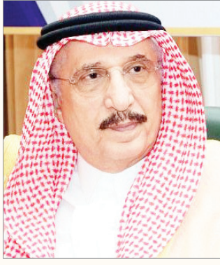
الأمير محمد بن ناصر

وأشار سموه إلى أن ذكرى اليوم الوطني الخالدة تأتي في عامها الحالي والوطن والمواطن يرفل في رعد العيش والسعة والأمن والأمان في عهد ملك الحزم والعزم خادم الحرمين الشريفين الملك سلمان بن عبدالعزيز آل سعود . حفظه الله . الذي يولي قضايا التحديث والتطوير والإصلاح في كل جوانب الحياة جل العناية والاهتمام والرعاية مع الحفاظ في ذات الوقت على ثوابت الدين والأمة ، ليشهد القاضي والداني حجم التطور والنمو الذي شهدته وتشدده المملكة حتى أصبحت في مصاف الدول الأمم المتقدمة . وتابع سمو أمير جازان يقول : لقد استطاع خادم الحرمين الشريفين الملك سلمان بن عبدالعزيز آل سعود . حفظه الله . بتوفيق من الله تعالى ثم بتلاحم شعبه من حوله أن يحول معركة البناء والتحديث إلى ملحمة إنجاز تتواصل من جيل إلى جيل ومن بناء إلى بناء ، ومن حلم إلى حقيقة في عمل متواصل بمزيد من التخطيط ووضع الاستراتيجيات التي تحقق الأمل الدائم بأمن يعم الأرجاء ورخاء يفيد منه الجميع وتنمية مستدامة لا تستغني شبرا من تراب هذا الوطن المعطاء . وثمن سمو الأمير محمد بن ناصر بن عبدالعزيز عاليا حجم الجهد والتضحية والفداء التي يبذلها جنودنا المخلصين على حدود الوطن نحرًا للأداء وردعًا كل من تسول له نفسه النيل من أمن وسيادة بلد الحرمين ومقدساته ، مقدما لهم التهنية بهذه المناسبة العزيزة سائلا الله تعالى أن يحفظ هذه البلاد في ظل قيادتها الرشيدة وجميع بلاد المسلمين من كل مكروه .