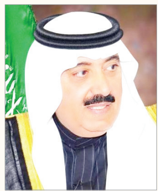
الأمير متعب بن عبد الله

أيدها الله - وتعمل على تحقيقها في جميع المجالات " . وأوضح سمو الأمير متعب بن عبد الله، أن وزارة الحرس الوطني إحدى مكونات هذه المنظومة وتعزز دورها الوطني بمختلف أبعاده العسكرية والصحية والثقافية في إطار رسالتها الحضارية المتكاملة للإسهام في تعزيز التنمية الشاملة لهذا الوطن الغالي ، والسير نحو المزيد من الإنجازات والمكتسبات للوطن والمواطن . ونوه سمو وزير الحرس الوطني، بما أولته حكومتنا الرشيدة من اهتمام بالقوات العسكرية إذ حرصت على تطويرها لتكون قادرة على حماية مكتسبات الوطن والذود عن مقدساته والحفاظ على مقدراته ، فنالت القطاعات العسكرية الحظ الأوفر في منظومة التنمية، وقال سموه " ما تقوم به قواتنا العسكرية الباسلة لحماية حدودنا الجنوبية وما سطرته من تضحيات كبيرة يعد دليلاً على الإعداد السليم والجاهزية العالية والشجاعة والإقدام التي تتمتع بها القوات السعودية بكافة قطاعاتها ، ومنها الحرس الوطني الذي يعتز بالدور الذي يؤديه وما أسند إليه من مهام ، معتمداً على تأهيل منسوبيه وما اكتسبه من المعارف والعلوم والنظم العسكرية الحديثة ، مجدين عهد الولاء والطاعة لسيدنا خادم الحرمين الشريفين الملك سلمان بن عبدالعزيز آل سعود - حفظه الله - . وأوضح سموه بمناسبة ذكرى اليوم الوطني باسمه واسم منسوبي وزارة الحرس الوطني كافة التهاني والتبريكات لخادم الحرمين الشريفين الملك سلمان بن عبدالعزيز آل سعود - أيده الله - وللشعب السعودي النبيل، مبهتلاً إلى العلي القدير أن يؤيد قواتنا المرابطة على الحدود وأن يحفظ هذا الوطن آمناً مطمئناً ، وأن يوفقنا جميعاً ما يحبه ويرضاه .