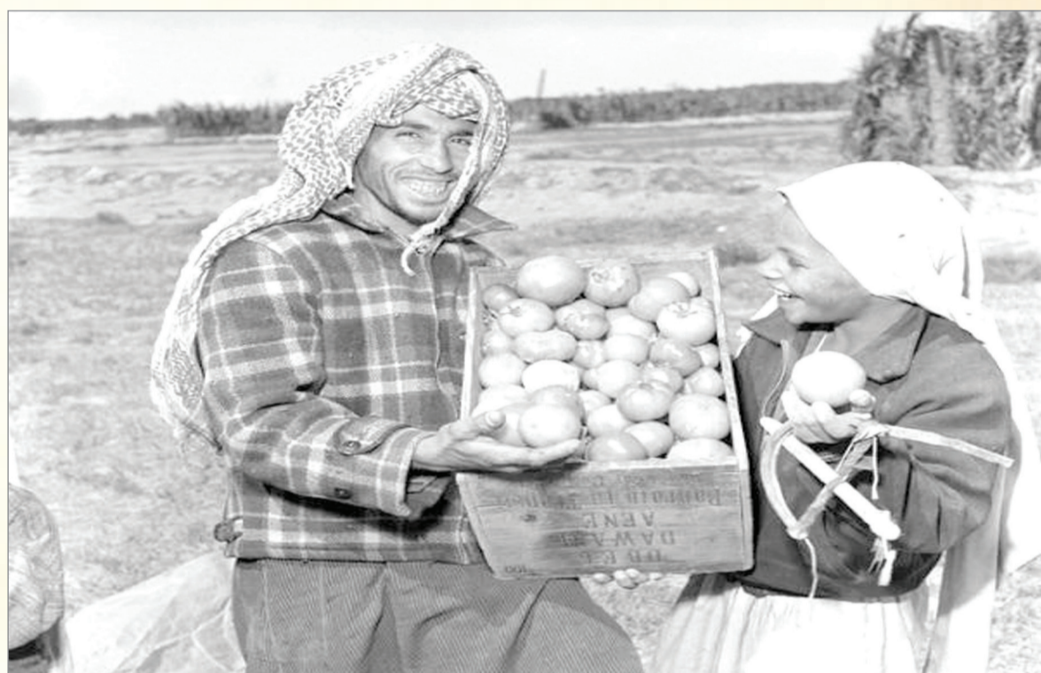
ابتسامه فرح بحصاد (الطماطم) - قطيف - الخمسينيات