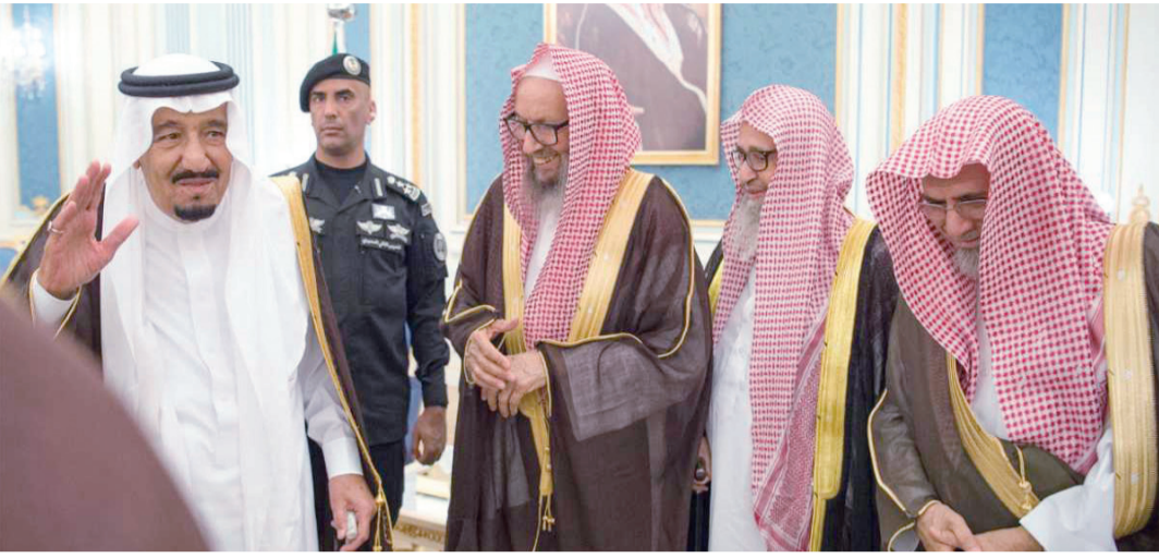
خادم الحرمين الشريفين يستقبل الأمراء والمفتي العام والمواطنين.. ص 3