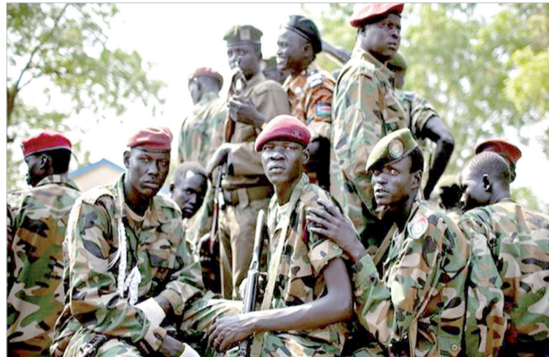
جنوب السودان تعرقل نشر قوة الحماية. وأندلقت قتال عنيف استخدمت فيه دبابات وطائرات هليكوبتر لعدة أيام في جوبا الشهر الماضي بين قوات موالية للرئيس سلفا كير وقوات مؤيدة لريك مشارك النائب السابق للرئيس مما أثار مخاوف من العودة إلى

حرب أهلية كاملة في أحدث دولة في العالم. وقتل مئات الأشخاص وقالت الأمم المتحدة إن جنودا حكوميين وقوات الأمن أدمت مدينتين واغتصبت نساء وفتيات بشكل جماعي خلال وبعد تفجر القتال. ورفض جنوب السودان هذه الاتهامات. وقالت الهيئة الحكومية للتنمية لدول شرق أفريقيا (إيجاد) إن جنوب السودان وافق على نشر قوة إقليمية وهو مطلب رئيسي لمشار الذي غادر جوبا في أعقاب أعمال العنف. وعين كير منذ ذلك الوقت نائبا جديدا للرئيس. وتحت مسودة القرار "الدول الأعضاء في المنطقة على التعجيل بالمساهمة بقوات للانتشار السريع لضمان الانتشار الكامل لقوة الحماية الإقليمية بأسرع ما يمكن". وستستمد مسودة القرار التفويض من قبل المجلس الأمن حتى ١٥ ديسمبر كانون الأول.