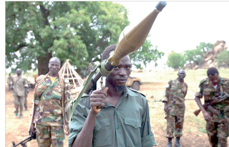
حظر على السلاح إذا قال الأمين العام للأمم المتحدة بان جي مون خلال شهر من إقرار مسودة القرار بأن الحكومة الانتقالية في

الأمم المتحدة - وكالات اقتربت الولايات المتحدة أن يجيز مجلس الأمن الدولي تشكيل قوة قوامها أربعة آلاف فرد لضمان السلام في جوبا عاصمة جنوب السودان والتهديد بفرض حظر على السلاح إذا لم تتعاون الحكومة الانتقالية هناك. ووزعت الولايات المتحدة مسودة قرار على أعضاء مجلس الأمن الخمسة عشرة أطلعت رويترز عليها تقترح إنشاء قوة حماية إقليمية تستخدم كل الوسائل اللازمة بما في ذلك القيام بخطوات قوية ونشطة والمشاركة في عمليات مباشرة عند الضرورة لتأمين جوبا وحماية المطار والمنشآت الرئيسية الأخرى. وستكون قوة الحماية تلك جزءا من بعثة الأمم المتحدة لحفظ السلام في جنوب السودان المعروفة باسم يونيميس والمتواجدة هناك منذ أن حصل جنوب السودان على الاستقلال عن السودان في