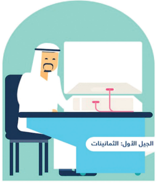
الجيل الأول: الثمانينات

إستراتيجية ساما تركز على الأعمال تأسيس قسم الكمبيوتر لا وجود لمنصة تقنية المعلومات