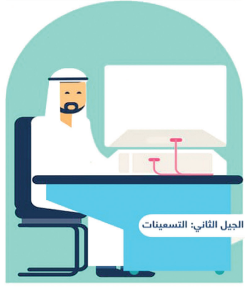
الجيل الثاني التسعينات

تأسيس منصة تقنية معلومات متطورة قسم الأعمال يقر بوجود قسم الكمبيوتر البدء ببناء تطبيق الأعمال لا قدرة على تقديم التقارير