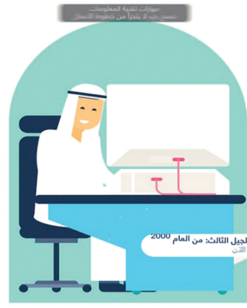
الجيل الثالث من العام 2000

المزيد من المنشآت التجارية تبدأ باستخدام تقنية المعلومات تزايد الطلب على تقنية المعلومات من قبل الأعمال