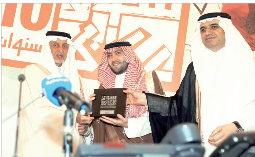
الأمير خالد الفيصل يسلم طارق إسماعيل درع التكريم

هذه هي السنة الثانية التي تقوم فيها مجموعة صافولا الاجتماعية التي تهدف إلى تحفيز التنمية المستدامة التي تلبى احتياجات المجتمع التي هي جزء لا يتجزأ منه. برعاية سوق عكاظ كما تتبنى عدداً من برامج المسؤولية