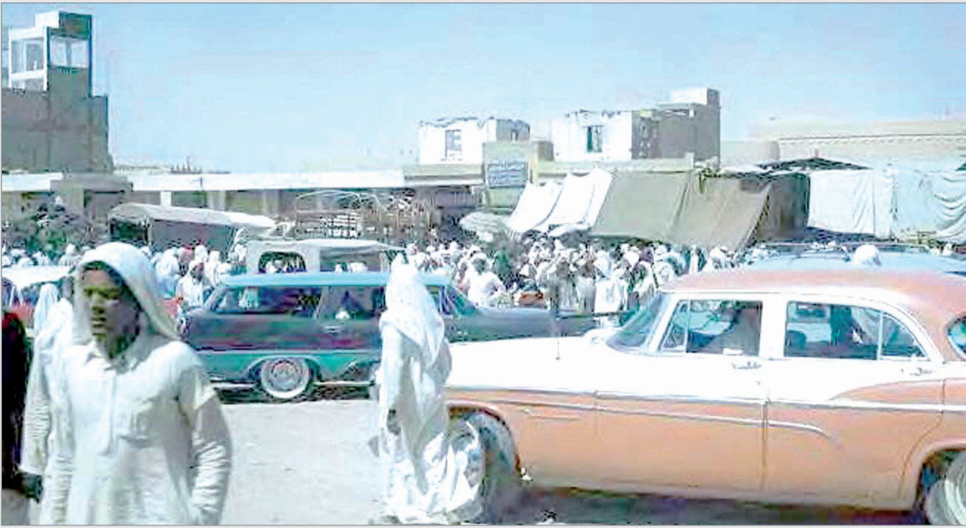
الرياض - وسط البلد