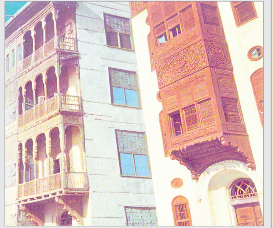
رواشين جدة - ١٣٨٨ هـ