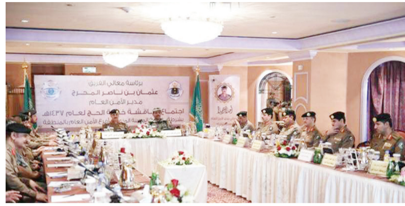
استمع الفريق المحرج لشرح واف عن الخطط المعدة من أفرع الأمن الرئيسية خلال هذا الموسم قوات الطوارئ الخاصة- الكثافات في الروضة الشريفة وأثناء السلام على الرسول صلى الله عليه وسلم وصاحبه رضي الله عنهما.

وفور وصوله اجتمع الفريق المحرج بمدير شرطة منطقة المدينة المنورة ومدرائه وقادة أفرع الأمن العام الذين عرضوا خططهم الأمنية والمرورية والتنظيمية وخطط الطوارئ في المسجد النبوي الشريف وساحاته وطريقة توزيع القوى العاملة والانتشار الميداني للقوى البشرية والطريقة التي ستتم بها إدارة الحشود عند دخال المسجد النبوي وتوزيع