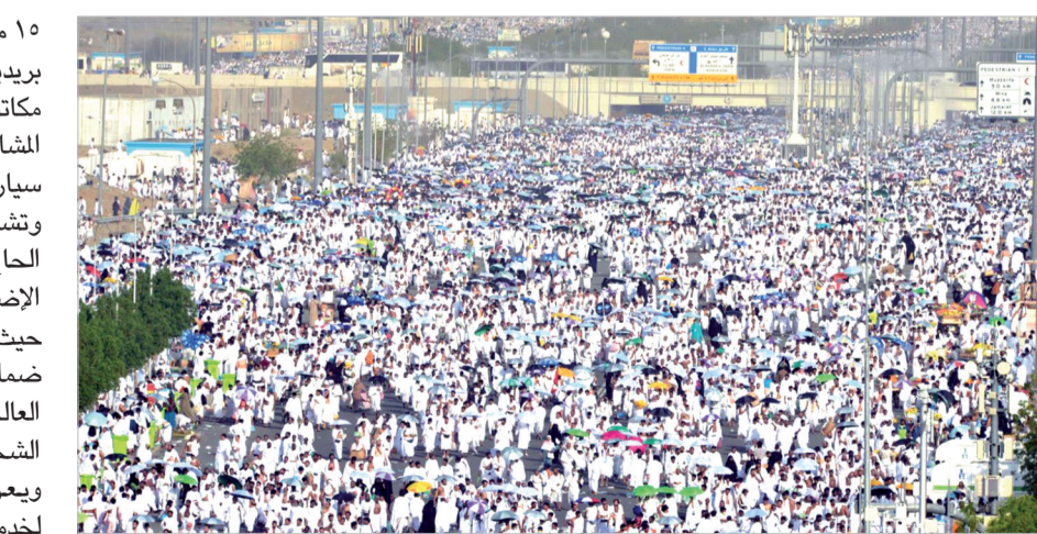
١٤٢٧هـ في مكة المكرمة والمدينة المنورة، إذ انطلقت الخطة من ١٥ ذي القعدة من الجاري وتستمر حتى

١٥ مجرم ١٤٢٨ هـ، من خلال شبكة تضم ٣٢ مكتباً بريدياً في مكة المكرمة والمدينة المنورة والمشار، و ٥ مكاتب في منى و مكتب في عرفة وأخر في منى و المشار بمشاركة أكثر ٦٤٥ موظفاً ومساندة ١٥٠ سيارة و٧١ دراجة نارية. وتشمل خدمات البريد في موسم الحج خدمة "طرود الحاج" الهادفة إلى الإسهام في الحد من الأوزان الإضافية، التي يضطر الحاج لحملها أثناء تنقله حيث يقدم البريد هذه الخدمة بأسعار تنافسية مع ضمان وصول تلك الطرود للعملاء في مختلف أنحاء العالم من خلال اتفاقيات خاصة أبرمتها مع شركات الشحن العالمية. ويعزز جودة هذه الخدمة رحلات النقل البريدي لخدمات البريد الرسمي والممتاز بما يسهم في سرعة إيصال طرود ضيوف الرحمن إلى بلدانهم في جميع قارات العالم وذويهم بشكل دقيق وفي زمان قياسي.