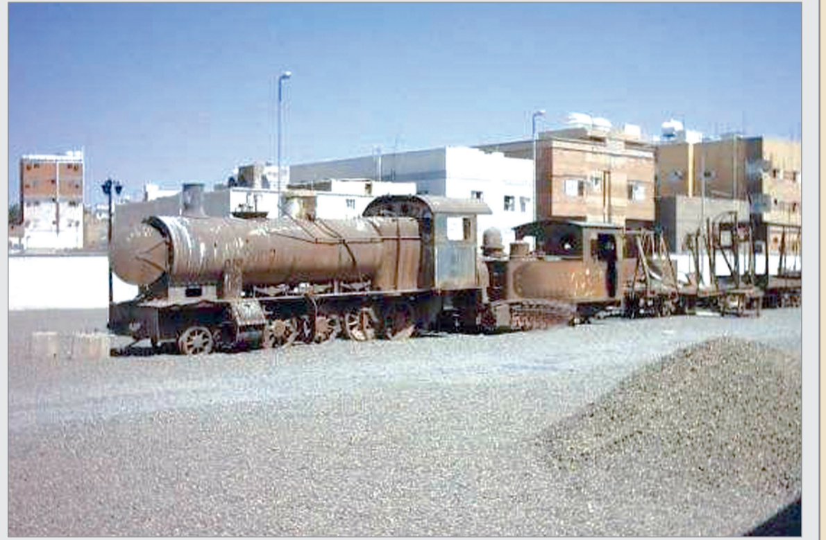
قطار الحجاز القديم بالمدينة المنورة