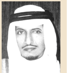
فهد بن سعد