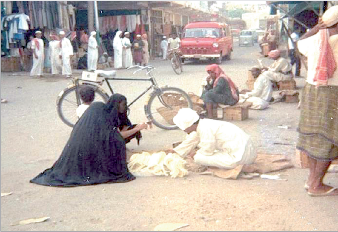
من اسواق جدة القديمة