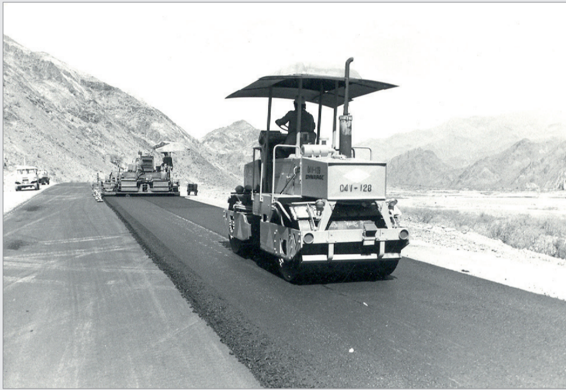
ملاح النهضة التي شهدتها المملكة في السبعينيات الميلادية وقد شملت انشاء مجموعة من الطرق التي تربط بين المدن