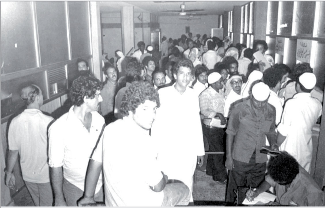
مراجعين بمكتب العمل