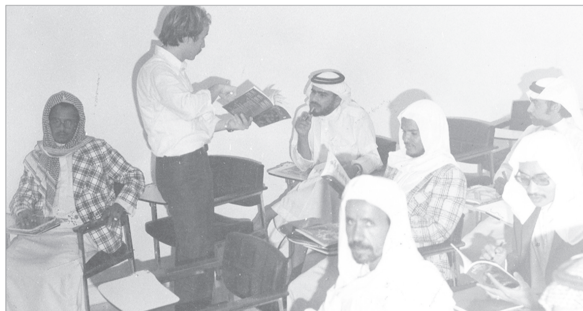
دورة في اللغة الانجليزية بمعهد الادارة