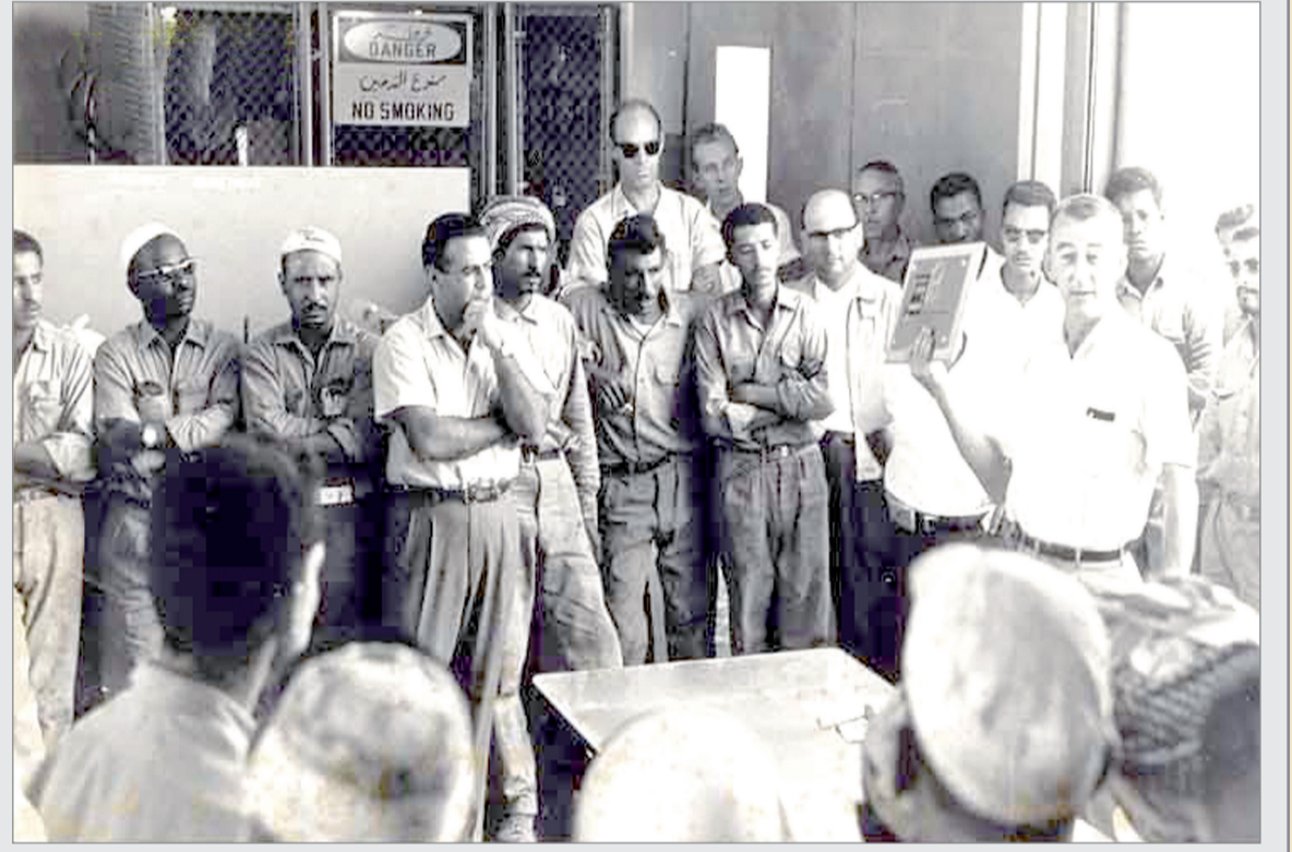
مجموعة من الموظفين اثناء توزيع جوائز السلامة في طريف