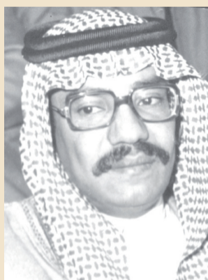
هذلول بن عبدالعزيز

• اصحاب السمو الامراء هذلول بن عبدالعزيز وفهد بن عبد الله وصلا من الرياض مساء امس. • يسافر الى بيروت اليوم الامير خالد بن عبد الله بن عبدالرحمن.