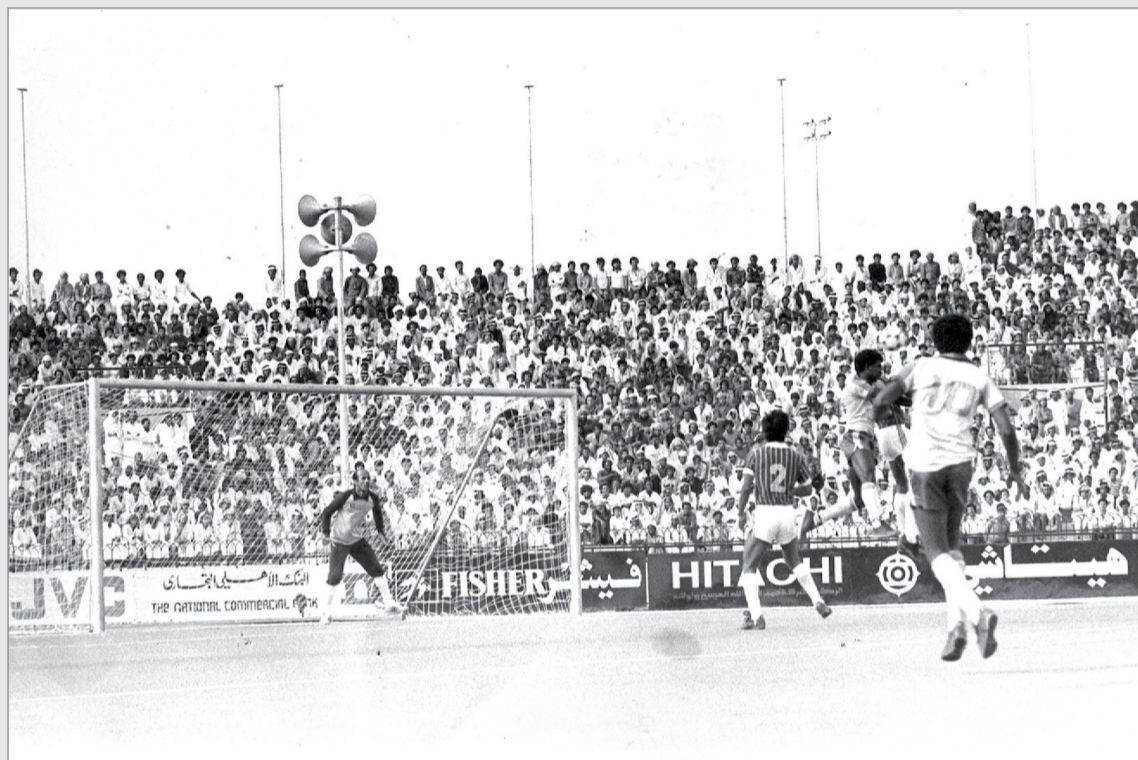
الهلال والاتحاد في لقاء جمعهما في الدوري الممتاز