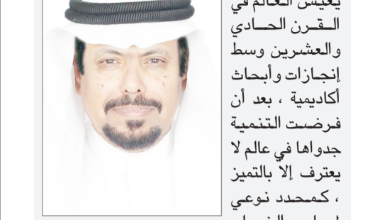
يعيش العالم في القرن الحادي والعشرين وسط إنجازات وأبحاث أكاديمية ، بعد أن فرضت التنمية جدواها في عالم لا يعترف إلا بالتميز ، كمحدد نوعي ، لمعايير النجاح لتتشكيل ملامح