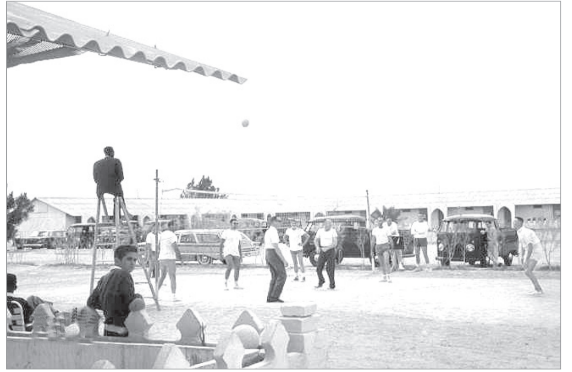
الخرج السبعينات الميلادية-