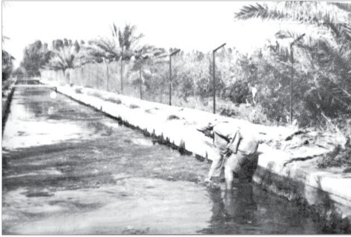
أحواض من الاسمنت المسلح تجري فيها المياه لري المزارع