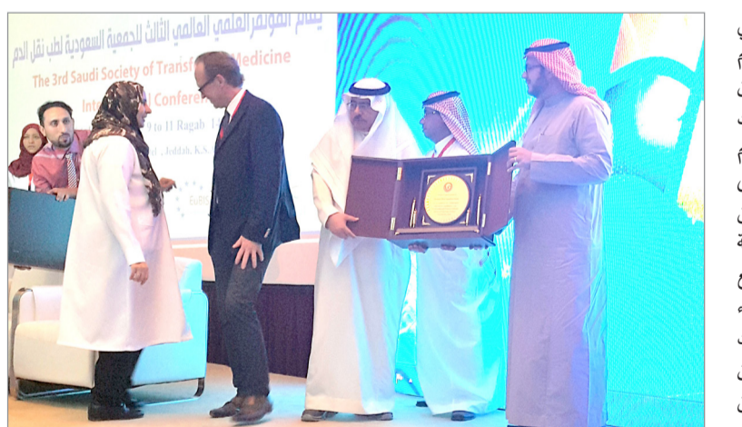
جانب من حفل افتتاح المؤتمر الطبي وتكريم الرعاية

الإمدادات الأمنة من الدم ومنتجاته في الوقت المناسب تعتبر أمراً حيوياً للنظام الصحي في السعودية نظراً لاستخدامه في الإجراءات الطبية والجراحية ومعالجة السرطان وأمراض الدم، وفي الاستجابة للحوادث والإصابات، ومعالجة حالات الطوارئ التوليدية. ويتم ذلك بالاعتماد على سخاء المتبرعين طوعاً بالدم بدون أجر، فالدم منحة الحياة، وإن عدم اتباع الممارسات الأمنة في نقل الدم ومنتجاته، يمكن أن يفضي إلى مخاطر تهدد الحياة، ويؤدي إلى انتشار الأمراض المعدية... وفي ختام حفل افتتاح المؤتمر، قام وكيل الوزارة للخدمات العلاجية الدكتور طريف يوسف بتكريم الجهات المشاركة وأعضاء اللجنة المنظمة للمؤتمر وشكرهم على مجهودهم في إقامة وتنظيم هذا المؤتمر الهام.