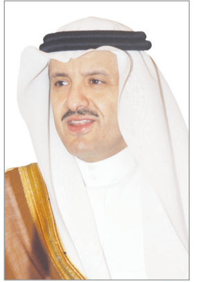
سلطان بن سلمان