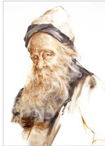
ظل يحمل مظهره الخادع لمن لا يعرفه فاذا تكلم يخدعك بلغظه الكاذب.. له ميزة واحدة اعترف

كنا نراه في مجتمعنا الصغير مثالا في شخصيته وسلوكه.. كنا نراه وذلك الانسان صاحب الرأي والموقف الذي يعطي للأمور احقيتها في الصدق والوضوح . كنا نراه رجلا بكل ما تعني هذه الكلمة من معنى.