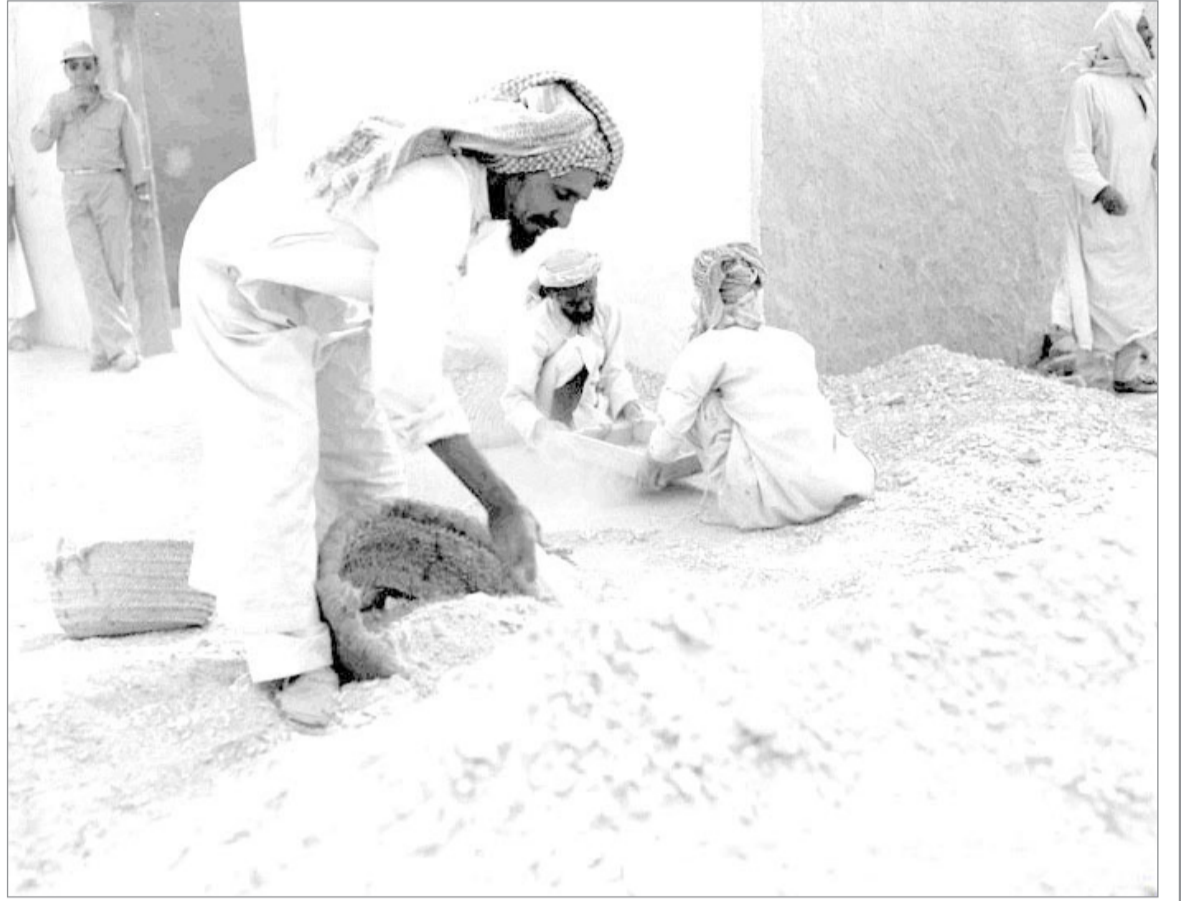
برنامج زراعي في الخرج برعاية السيد أوليقر ١٩٤٩ م